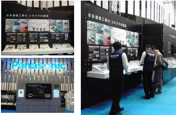
CEATEC JAPAN 2011(10/4~8) パナソニック電工株式会社ブースにて出展

パナソニック株式会社のグループ再編に伴い、2012年1月1日付で、パナソニック電工株式会社は、パナソニック株式会社に吸収合併され、パナソニック電工株式会社が保有する弊社の全株式が、パナソニック株式会社へ承継されました。そのため、弊社の筆頭株主がパナソニック電工株式会社からパナソニック株式会社となりました。